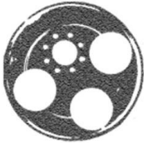
Код 05.016 ограничитель

При установке в комплекте с пилой дисковой - ревизионный стернотом.